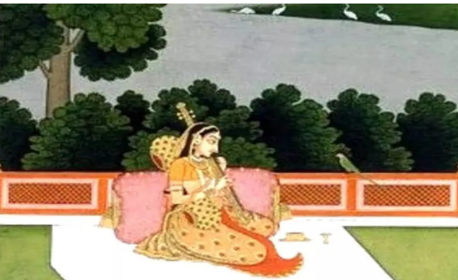
Kalidasa's verses show how the flora and fauna around us are intimately connected with our own lives.

कालिदासः वर्षाकालस्य वर्णनं कुर्वन् अनेकानि प्रकृतिरूपाणि जीवन्तं कृतवान्। मेघाः विद्युत् च : मेघाः यौन-उत्तेजिताः प्रेमिणः रूपेण चित्रिताः सन्ति, ये विद्युत्-विभूषिताः सन्ति। इन्द्रधनुषः तेषां अलङ्कारः इति वर्णितः अस्ति। नद्यः जलप्रपाताः च : वर्षाजलेन पूरिताः नद्यः जलप्रपाताः च तीव्रगत्या प्रवहन्ति, येन प्रकृतेः सामर्थ्यं आनन्दः च दृश्यते। वनस्पतिजन्तुः- कदम्बा, केतकी, जम्बू च पुष्पाणि प्रफुल्लितानि सन्ति, येषां सुगन्धेन वातावरणं सुगन्धितं भवति। मयूरा मण्डूकादयः पशवः वर्षागमने प्रसन्नाः भवन्ति।